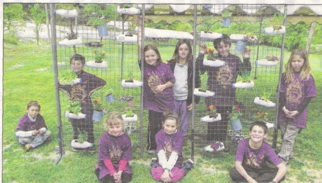
Les enfants ont réalisé des jardinières suspendus et rempotés leur semis de légumes qu'ils planteront dans leur potager aujourd'hui.

La dixième édition de la fête du Narcisse se poursuit aujourd'hui avec une journée chargée, dès 10 heures : sorties et conférences gratuites autour du potager ; 12h30 : Apéritif d'honneur. Toute la journée, le Crieur du Verdon, grand marché nature, déambulation musicale, vente de livres, concours de nez, distillation de thym sauvage, vente de semences, de plants, de légumes, de fleurs, de plantes aromatiques et médicinales... Nombreux ateliers divers et variés seront ouverts à tous. Buvette et restauration sur place. Informations : www.lamartre.fr