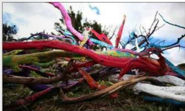
Le bois constitue un support artistique privilégié.