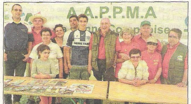
Toute l'équipe organisatrice et une partie des participants réunis sous la tente d'exposition.