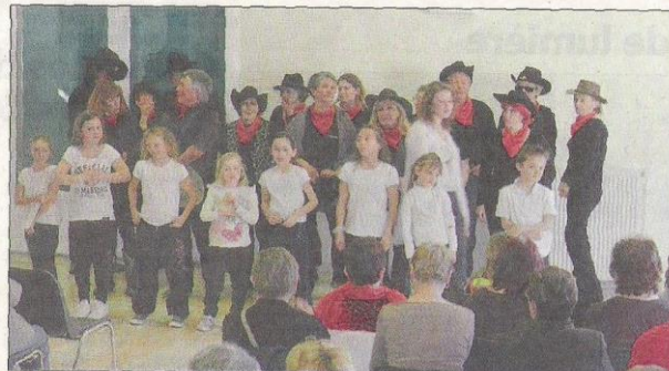
Finale du spectacle avec la chanson des Restos reprise en cœur.

Un grand loto à suivi avec la participation des commerçants, artisans, producteurs et artistes du canton de Comps et une centaine de personnes qui ont répondu présents à l'appel. Grâce aux diverses ventes et actions menées durant la journée, c'est un chèque global de près de 1000 €