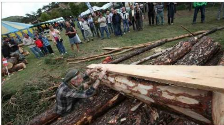
«Bouscat», le bouscatier de Bargemon fait la démonstration de son savoir-faire pour la découpe de planches dans un tronc brut.

Terminons en beauté avec Giono qui, dans l'Eau Vive, publié en 1943, écrit : « Les bûcherons s'étaient retirés loin vers les combes hautes. De temps en temps, un ou deux bouscatiers sortaient du bois. »