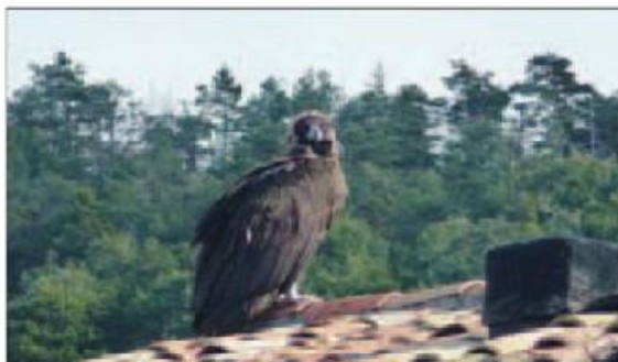
Le superbe rapace est resté une partie de la journée sur le toit d'une habitation.

Le rapace, bagué, est arrivé très certainement de la réserve des Gorges du Verdon. Cet invité surprise très imposant a intrigué les habitants qui ne se sont pas privés de l'admirer.