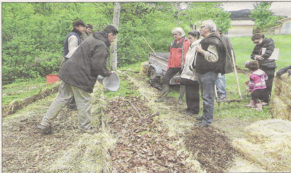
Aux premiers rayons de soleil, les visiteurs étaient nombreux à l'espace Fontvieille ce dimanche. Tous ont appris beaucoup sur les thèmes du potager, la culture, la biodiversité et la nature.

Pour la dixième année consécutive, la BCM animation organisait ce week-end la fête du narcissisme. Malgré les caprices du temps, le programme est resté inchangé et hier le public était fidèle au rendez-vous. De nombreux exposants pour le grand marché « Na-