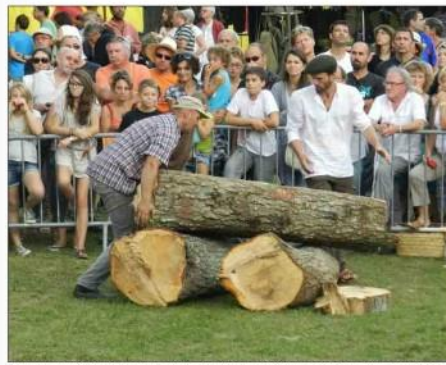
Pour la première fois cette année, la fête de la forêt et du bois fera aussi place belle aux femmes maniant la tronçonneuse.

« Nous avons voulu innover et casser le cliché du bûcheron viril », explique une organisatrice qui prendra part à cette toute première compétition dédiée à la gent féminine. Le but est de dire à tout le monde que ce n'est pas uniquement réservé aux hommes ». Et visiblement, la création de ce concours, répond à un réel désir. « L'année dernière il y a des filles qui sont venues me voir à la fin des épreuves pour me demander de participer au concours de bûcheron-