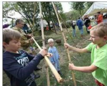
Comment fabriquer une cabane en bois.