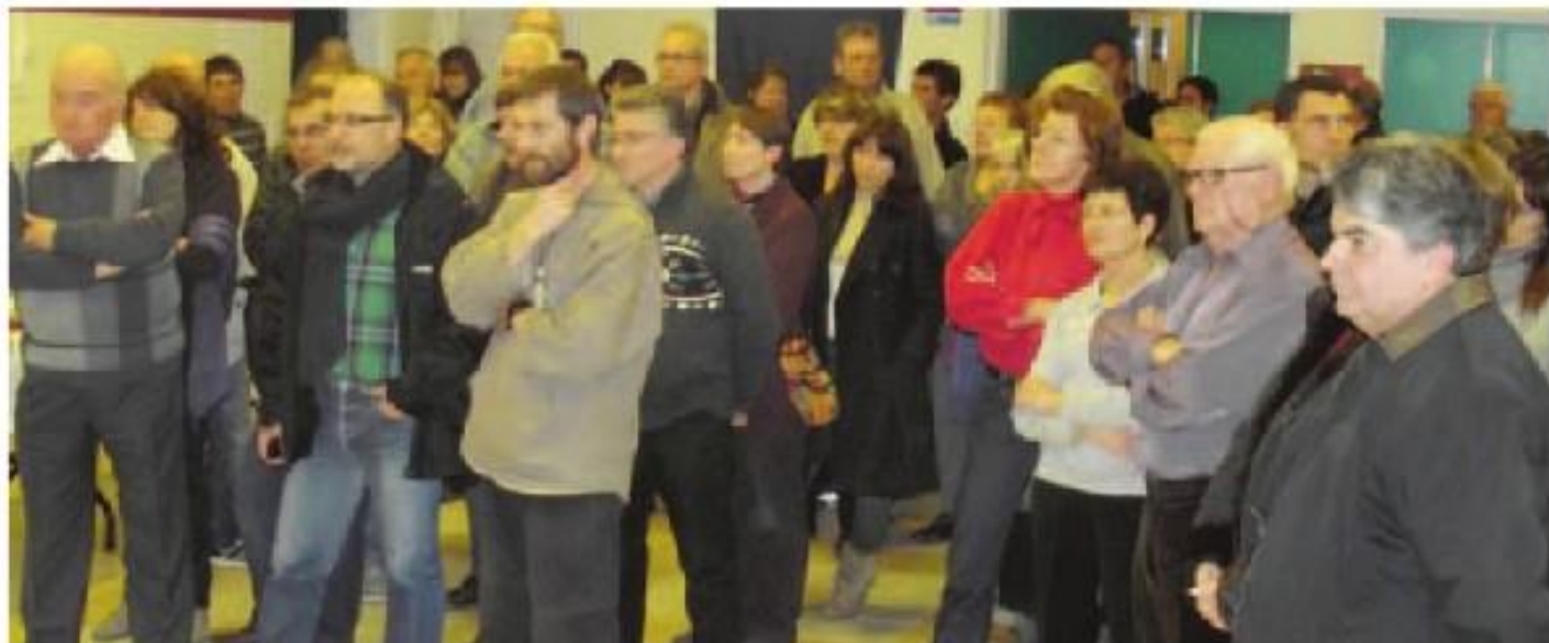
Les habitants du village ont répondu présent pour la présentation des vœux et l'apéritif dînatoire qui a suivi.