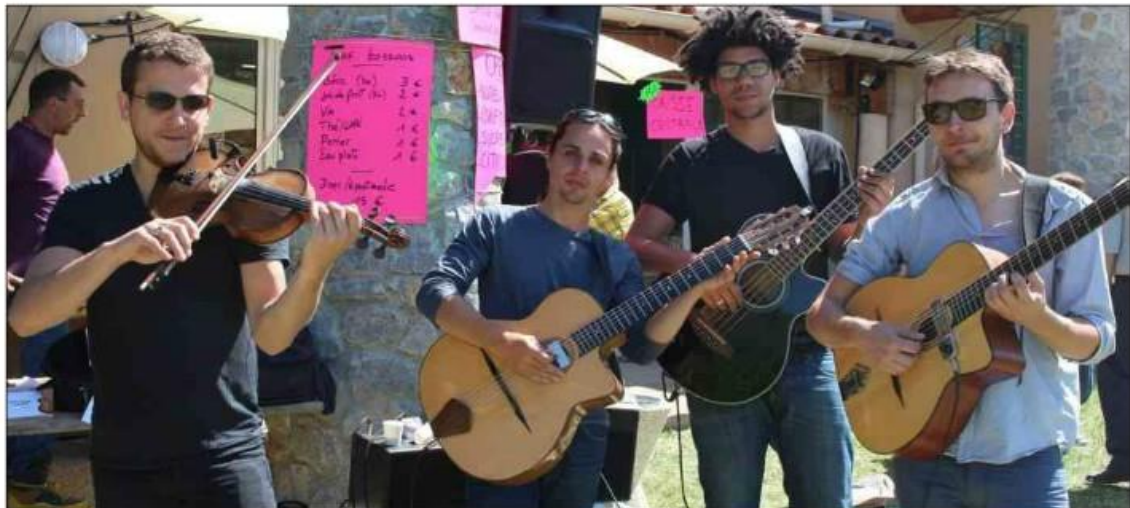
Le groupe « Gala Swing Quartet » a brillamment mis l'ambiance tout au long de cette journée festive !