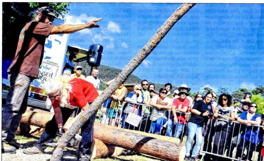
Démonstrations et concours autour des métiers du bois animent le village de La Martre jusqu'à ce soir.

À partir de 8 heures. Concours de bûcheronnage à 14 heures. Espace enfants. Buvette et restauration sur place. Entrée gratuite.