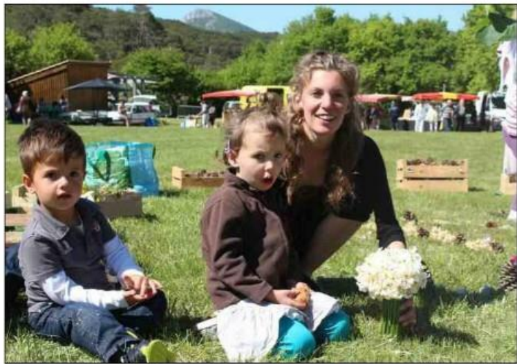
Hier, lors de la Fête du narcisse, tout le monde a respecté la tradition, sous un beau soleil.

Sous un soleil de plomb, hier, des centaines de personnes se sont réunies à l'espace Fontvieille pour la Fête du narcisse. Au programme : conférences, sorties, animations et ateliers qui ont connu un véritable succès. Après le temps capricieux des années précédentes, le soleil était bel et bien présent ce week-end pour le plus grand bonheur de chacun. Cette manifestation, organisée par la BCM Animation, est devenue l'événement incontournable du printemps. Qu'on se le dise, cette fête qui, à l'origine, était prévue le temps d'un week-end, joue les prolongations et cela fait onze années que ça dure. La Fête du narcisse, une tradition à La Martre qui a encore de longs jours devant elle pour rendre hommage aux cueilleurs présents dans la région jusqu'à la fin des années 1950.