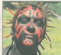
Les animateurs aussi, sont déguisés.

Textes : LAURIANE SANDRINI