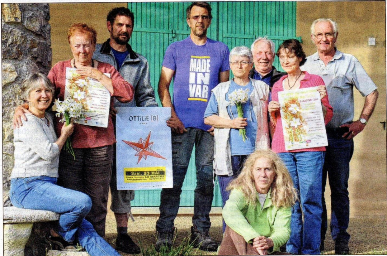
Les narcisses sont bien arrivés à la Martre.