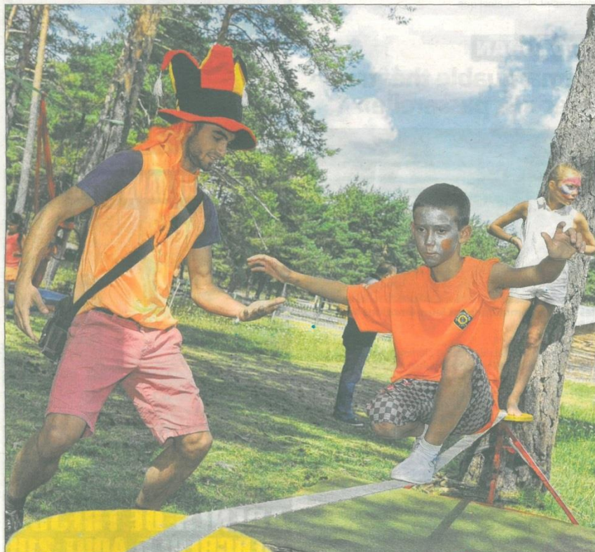
Avec le séjour spécialisé sur le cirque, les enfants apprennent à jouer au funambule.