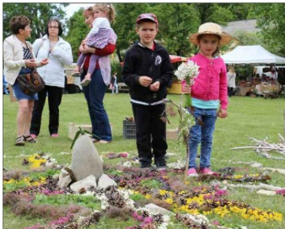
Les belles couleurs printanières de "Land-art nature" ont ravi les enfants.