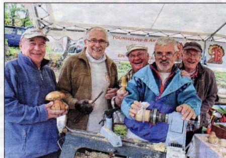
Les Tourneurs d'Art sur Bois en Provence fidèles depuis des années sur la manifestation.

La pluie n'aura pas eu le dernier mot ce week-end, au long de cette 9e édition de la Fête de la Forêt et du Bosc «entre les gouttes», mais avec un programme riche, un public fidèle au rendez-vous et de