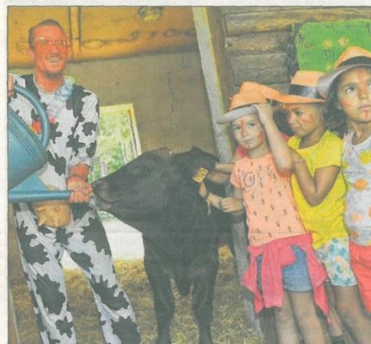
L'heure du biberon pour Totor le veau.