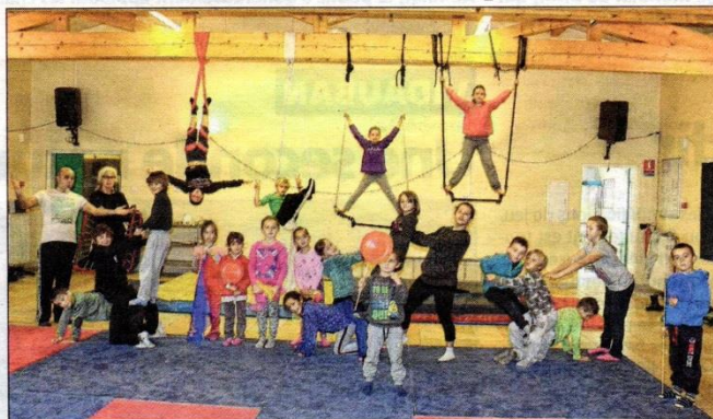
Préparatifs et mises au point avant la représentation finale.