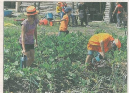
Les enfants apprennent à cultiver un potager.

Textes : LAURIANE SANDRINI