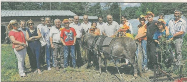
L'équipe de l'Odel Var avec des élus des 48 communes partenaires.

équestre, rassemblant 35 chevaux, ont offert une multitude d'activités, pour les débutants et confirmés, axées sur les soins aux animaux. Le Logis du Pin a d'ailleurs ouvert un nouveau mini-séjour pour les enfants de 4 à 8 ans, Petit fermier , pour s'occuper des animaux de la ferme. C'est au centre de la Clairière que les sportifs ont trouvé leur bonheur. Au programme : le nouveau séjour Mission commando , opération survie dans la nature, de la danse et du théâtre.