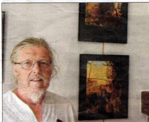
De sublimes photos à voir dans la salle de la mairie.

paysages des aspects de peinture impressionnistes », confie le photographe. Une exposition de sublimes photos, à voir dans la salle de la mairie visible jusqu'au 31 août durant les horaires d'ouverture du secrétariat.