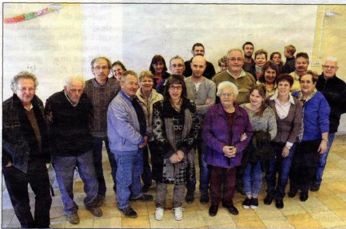
Les participants réunis à l'issue de la rencontre.

« Apprendre tout en s'amusant et de façon conviviale, hors des méthodes traditionnelles scolaires, telle est la recette », confiaient les in-