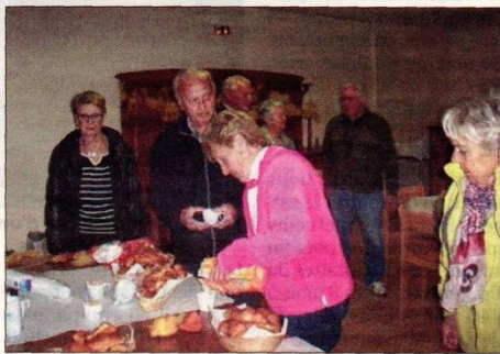
Accueil café à la Cheylane, avant une journée de découverte sur le site.