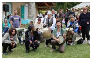
Déambulation musicale avec la Batucada « Les Wots » de l'ESAT de Valbonne à Cabasse.