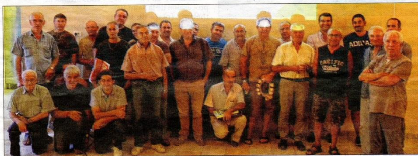
Les chasseurs réunis à l'issue de la réunion de sécurité annuelle.