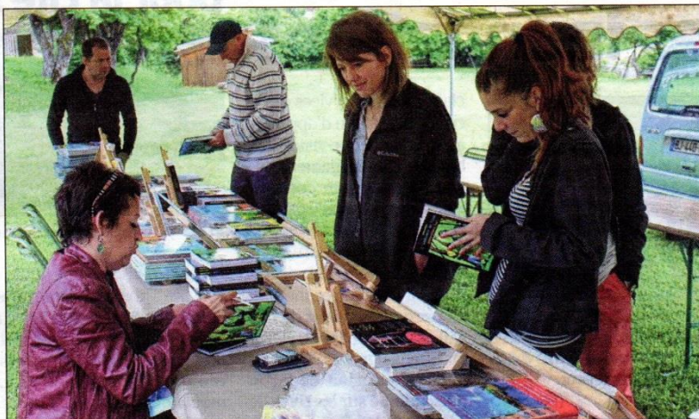
Des auteurs, des éditeurs, des conférences, des lectures en public... la deuxième Fête du livre promet d'être animée !