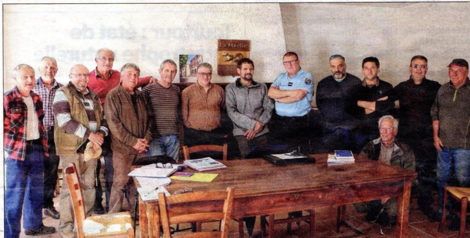
Les membres organisateurs et bénévoles réunis à l'issue de la réunion.