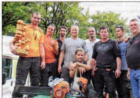
Les participants du concours réunis sur le podium pour la remise des prix.