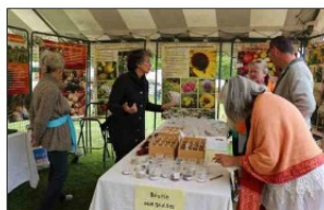
La bourse aux graines avec Longo Mai : très belle réussite pour une première à La Martre.