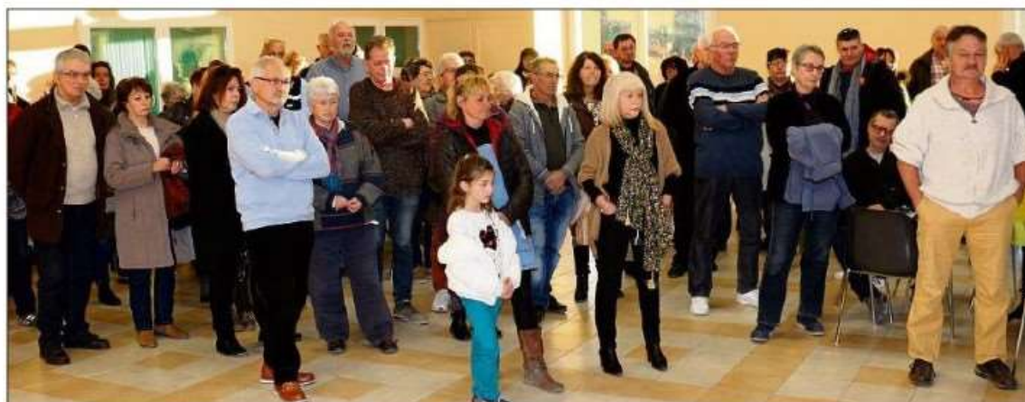
Les administrés n'ont pas manqué ce rendez-vous rituel...