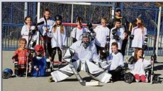
Une partie des licenciés.