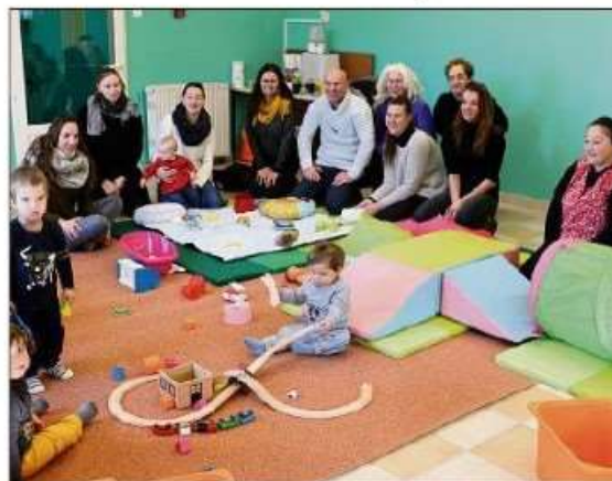
Les participants lors de la première séance.