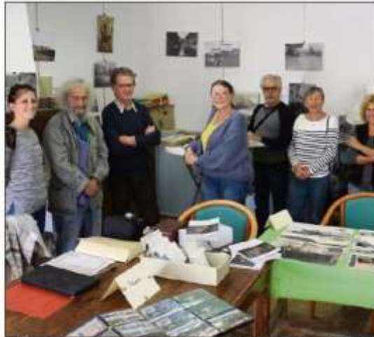
Villageois ou visiteurs ont pu plonger dans le passé. À droite, un exemplaire du journal Le Petit Niçois , daté de 1915.