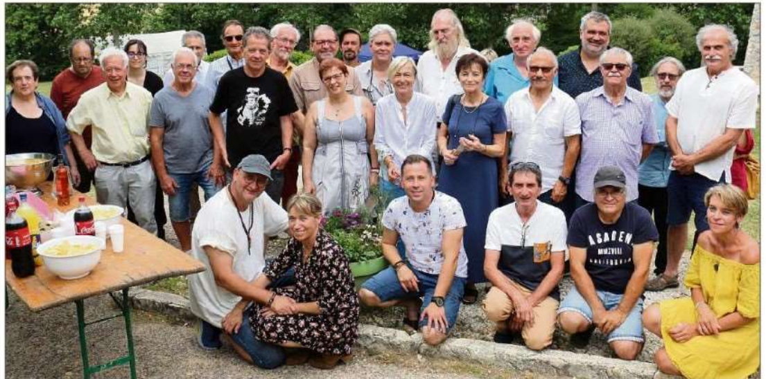
Les auteurs réunis à la mi-journée.